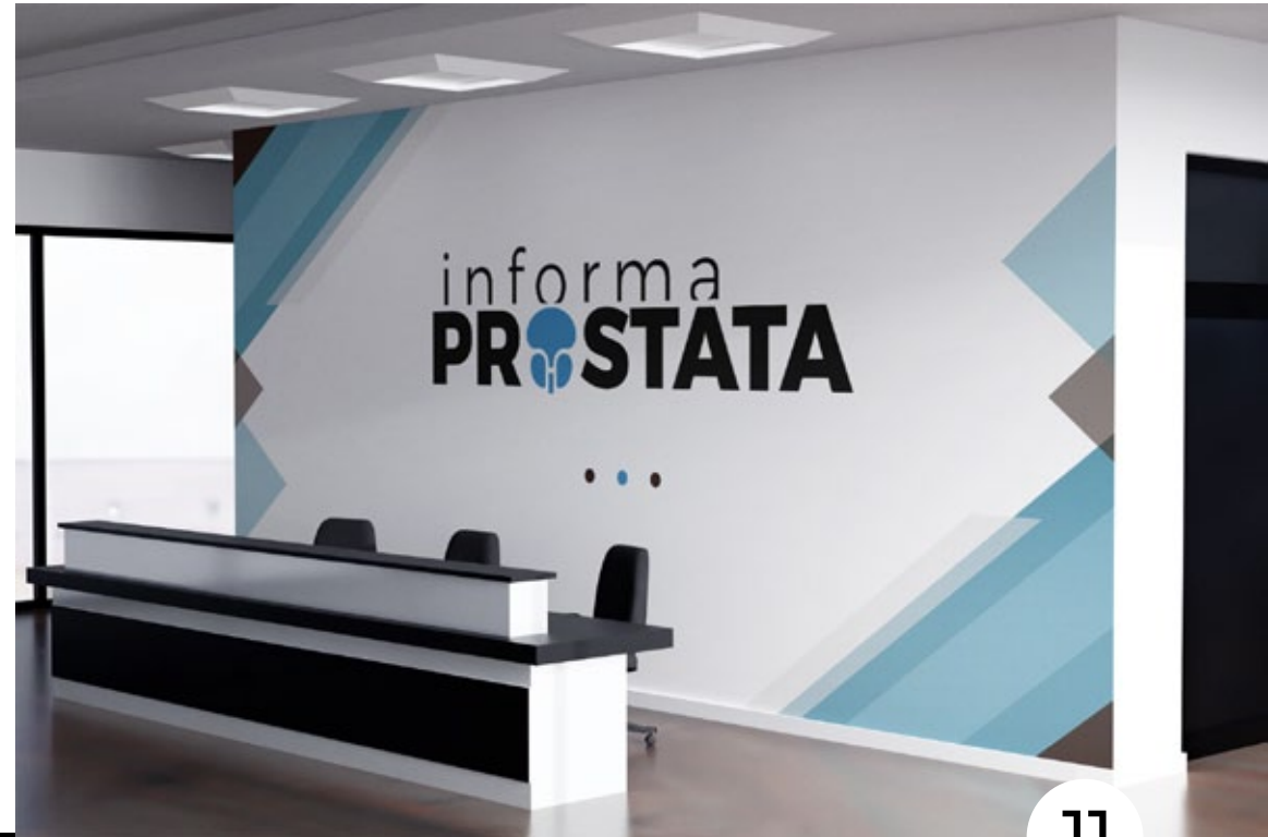
STAND/ INFO WALL